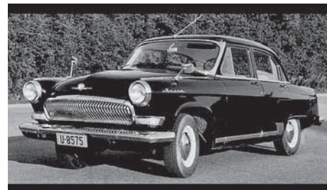
Volga: A keleti kényelem megtestesítője volt. A szovjetunió Gorkij nevű városában gyártották. A 80 lóerős motorjával akár a 130 km/órás sebességet is elérte.