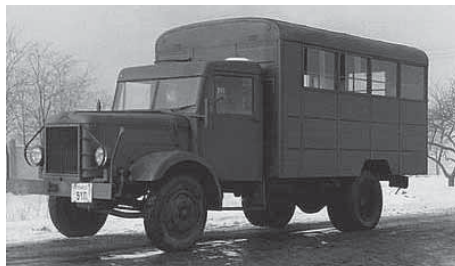
A fakarusz a '60-as években sokáig példásan szolgálta a magyar közlekedést.