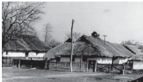
Ház a páston (1964).